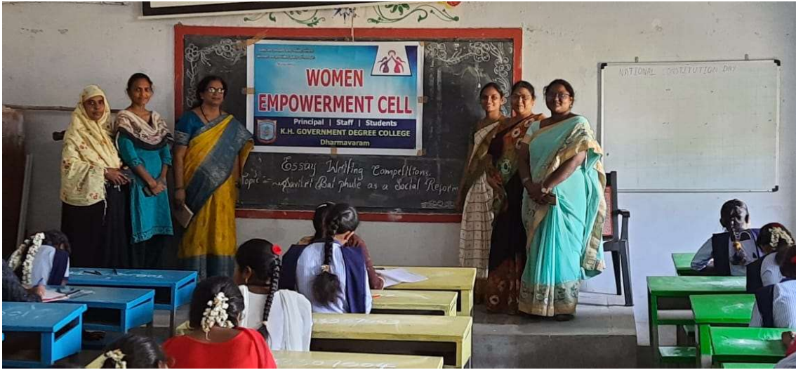
Conducted Essay writing Competition on Savitri Bhai phule as Social Reformer